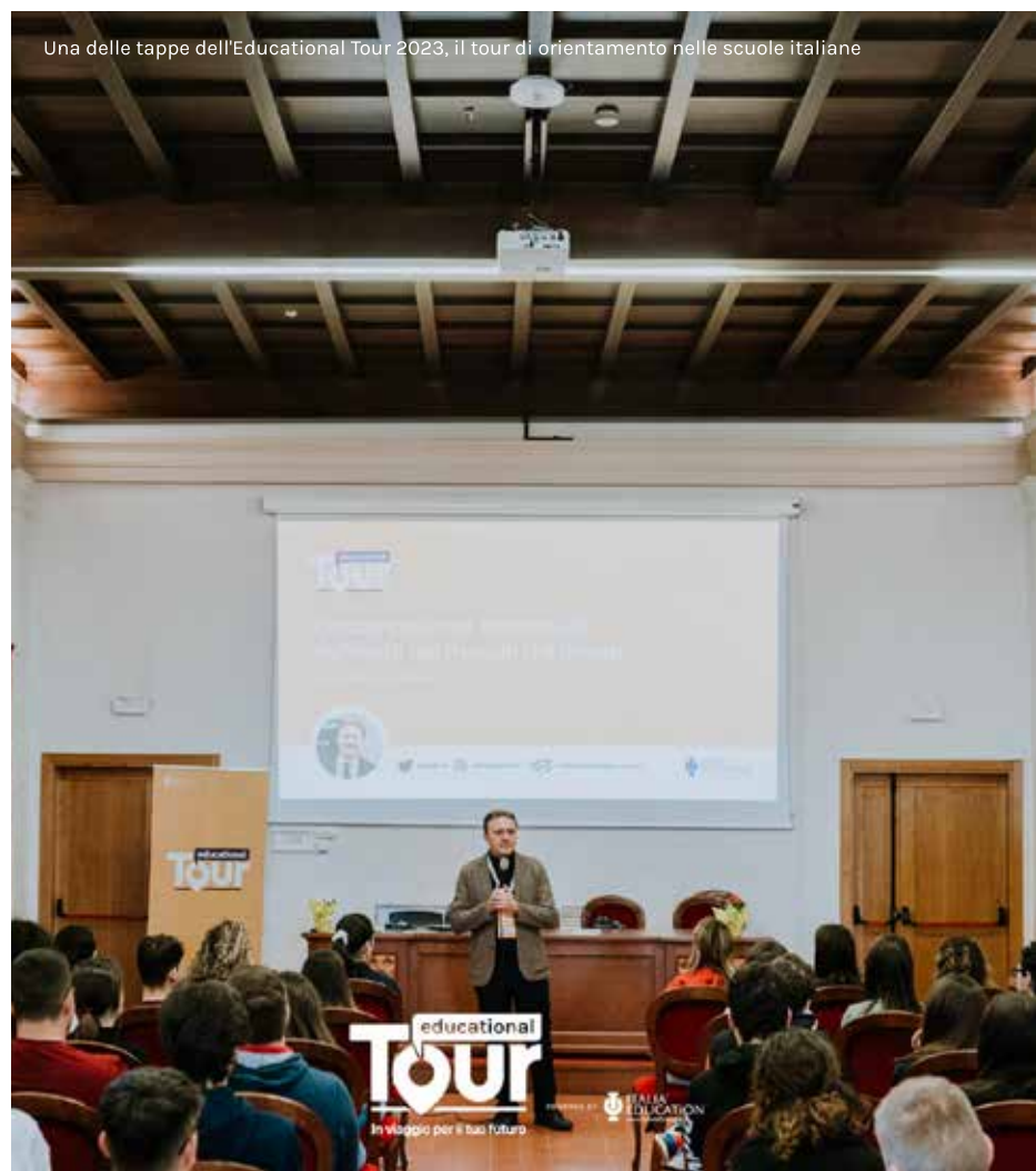
Una delle tappe dell'Educational Tour 2023, il tour di orientamento nelle scuole italiane